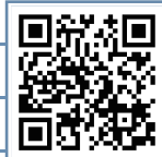
등록기관 검색 QR

사전연명의료의향서 등록기관은 우측 QR코드나 국립연명의료관리기관 누리집 (www.lst.go.kr)에서 검색하실 수 있습니다.